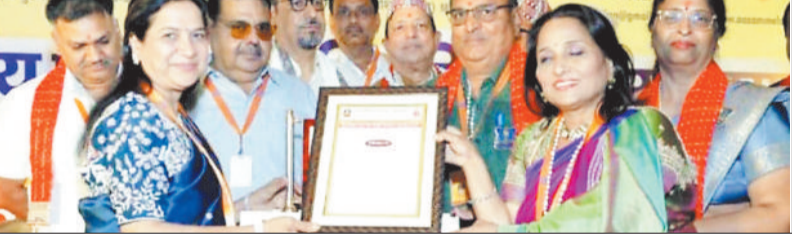
पुरस्कार प्राप्त करते उद्यमी।