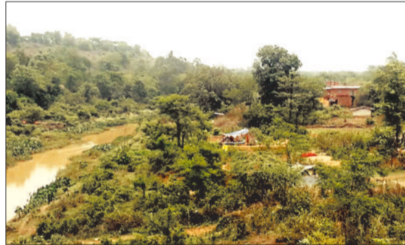
रिसदी मार्ग डेंगुरनाला के ऊपर बनते नए मकान।

कमी बनी हुई है। पिछले एक साल से शहर क्षेत्र के नदी नालों के किनारे बेजा कब्जा कर बस्तियां बसती जा रही है। वह भी ऐसे क्षेत्र जहां हमेशा बरसात में बारिश का पानी भर जाता है और समूचा क्षेत्र प्रशासन के सूची में बाढ़ प्रभावित क्षेत्र में शामिल है।