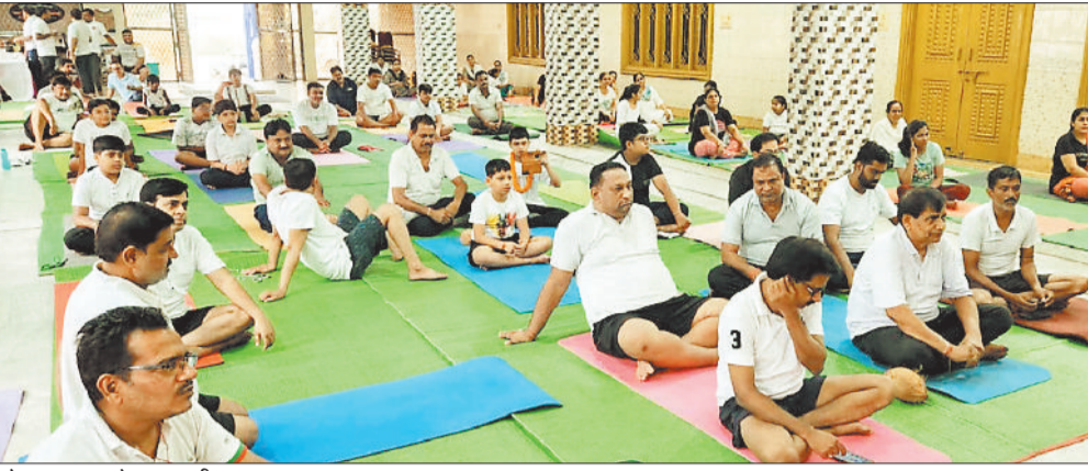
योगाभ्यास करते नगरवासी।