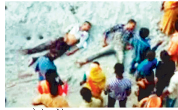
घटनास्थल में पड़े घुटकों के शव।

दोस्त का जन्मदिन मनाकर वापस लौट रहे बाइक सवार दो युवक जैसे ही भैसमा रेलवे फाटक पर बनी ओवरब्रिज पर पहुंचे बाइक पर उनका नियंत्रण खो गया और तेज रफ्तार आ नि यं त्रि त बा इ क ओवरब्रिज के बाड़ड़ीवाल से टकराकर 25 फीट नीचे जा गिरा। इस हादसे में बाइक सवार दोनों युवक की मौत हो गई। घटना उरगा थाना क्षेत्र की है।