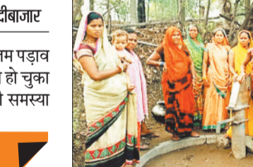
टिकरीपारा के निवासी।

भीषण गर्मी अब अपने अंतिम पड़ाव पर है। मानसून का आगमन हो चुका है। इसके बाद भी पानी की समस्या