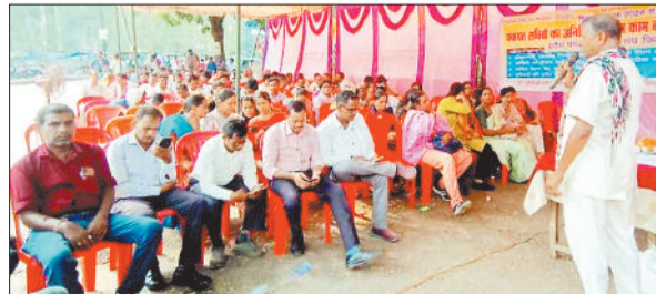
धरना देते पंचायत सचिव।

चार सूत्रीय मांगों को लेकर छग पंचायत सचिव संघ के आह्वान पर जिला इकाई ने सोमवार को अनिश्चितकालीन धरने की शुरुआत कर दी, जिससे अधिकांश ग्राम पंचायतों में सोमवार को होने वाली ग्राम सभा का आयोजन नहीं हो सका। ऐसे पंचायत सचिव की सूची तैयार की जा रही है जो हड़ताल पर गए हैं।