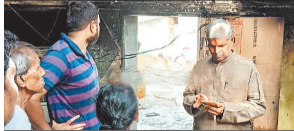
आगजनी के बाद परिवारों से मिलने पहुंचे महापौर।